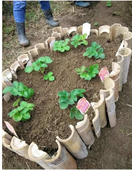
イチゴ苗の定植（トチオトメと宝交早生）