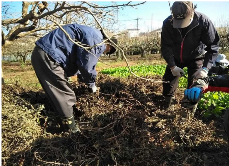
さつまいものツルカット（すき込む）