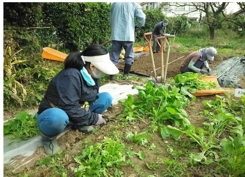
東京小松菜の収穫