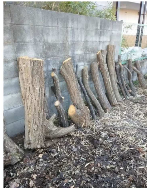
2年後の収穫が楽しみ!