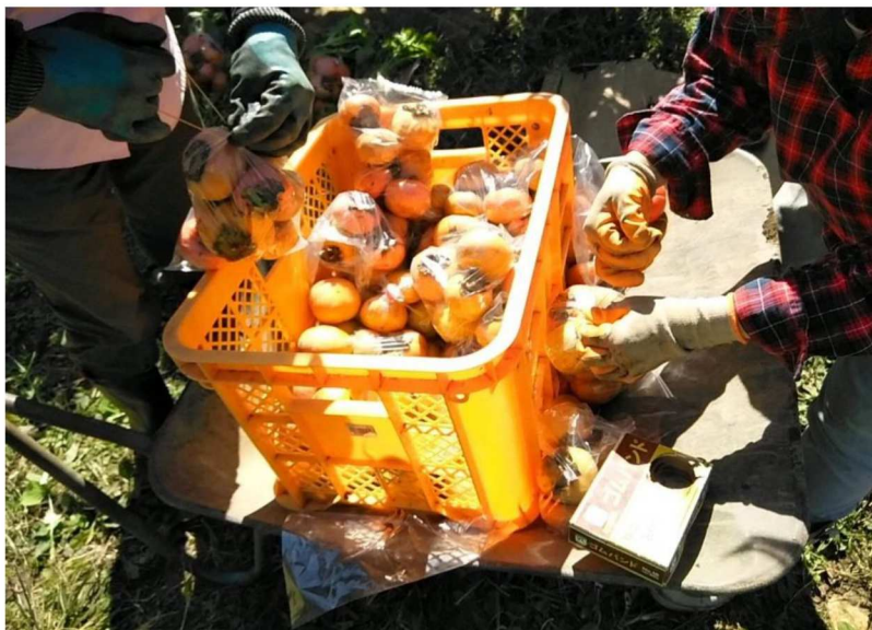
次郎柿がコンテナ満杯