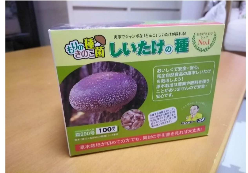
栗伐採の枝に椎茸種駒注入しました